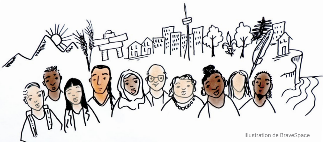
Illustration de BraveSpace

Les organismes à vocation sociale englobent l'ensemble du spectre des organismes effectuant du travail à vocation sociale, notamment les organismes de bienfaisance, les organismes à but non lucratif, les entreprises sociales, les coopératives, les coopératives de crédit, les fondations et les entreprises privées aux visées sociales ou environnementales.